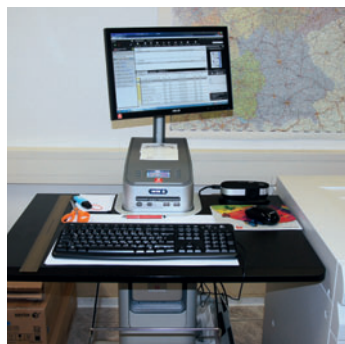
Der Druckserver Fiery EX 2100 bietet einen enormen Funktionsumfang. Er besitzt alle Voraussetzungen dafür, neue profitable Druckdienste anzubieten.

Die Xerox Versant 2100 Press verfügt über die leistungssteigernde Technologie Full Width Array mit Automated Colour Quality Suite (ACQS) und der Production Accurate Registration (PAR). Sie verarbeitet bis zu 100 Seiten pro Minute. Dank der neuartigen Ultra-HD-Auflösung erreichen die Ausdrucke eine sehr hohe Detailschärfe. Die vollautomatisierte Glättungs-